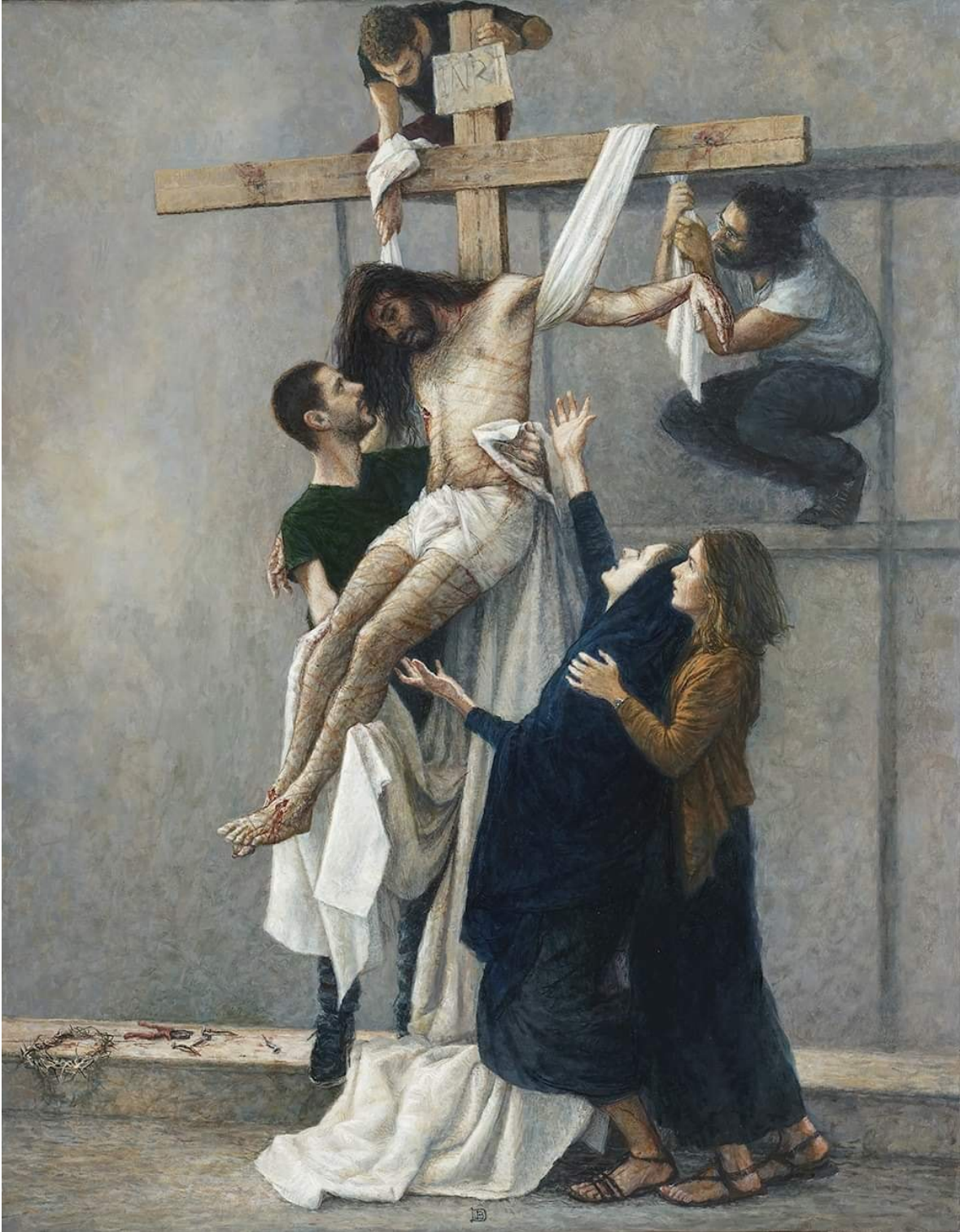
XIII Estación: Jesús es Descendido de la Cruz