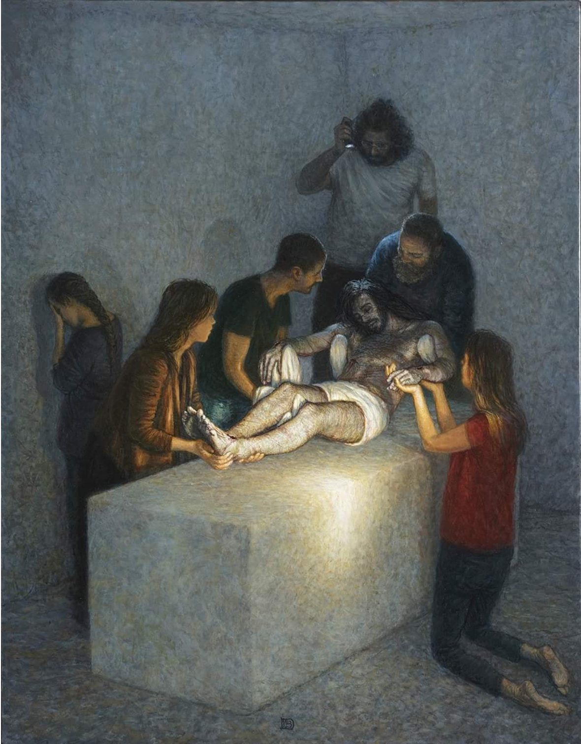
XIV: Jesús es Sepultado