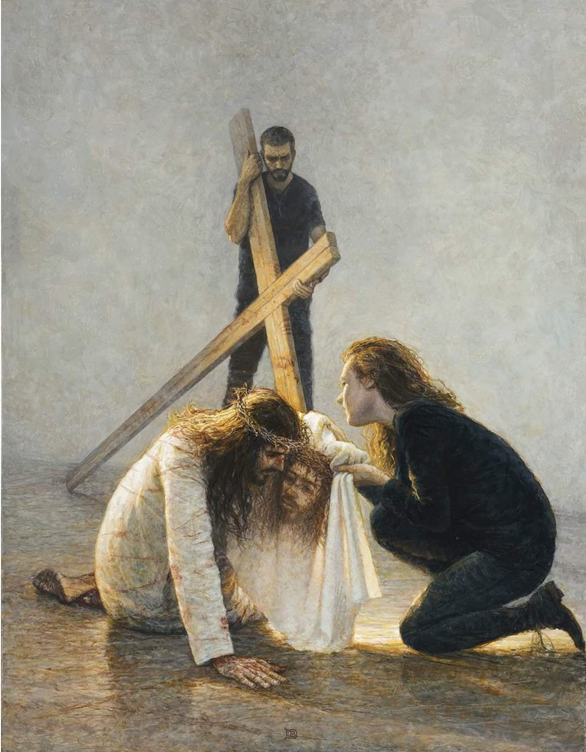
VI Estación: La Verónica Enjuga el Rostro de Jesús