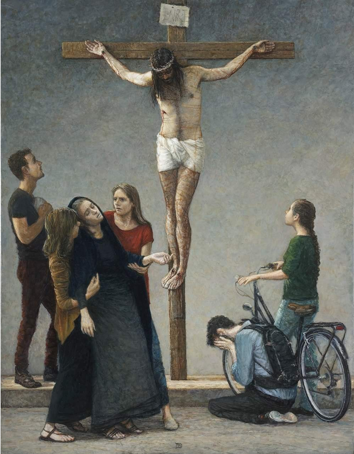
XII Estación: Jesús Muere en la Cruz