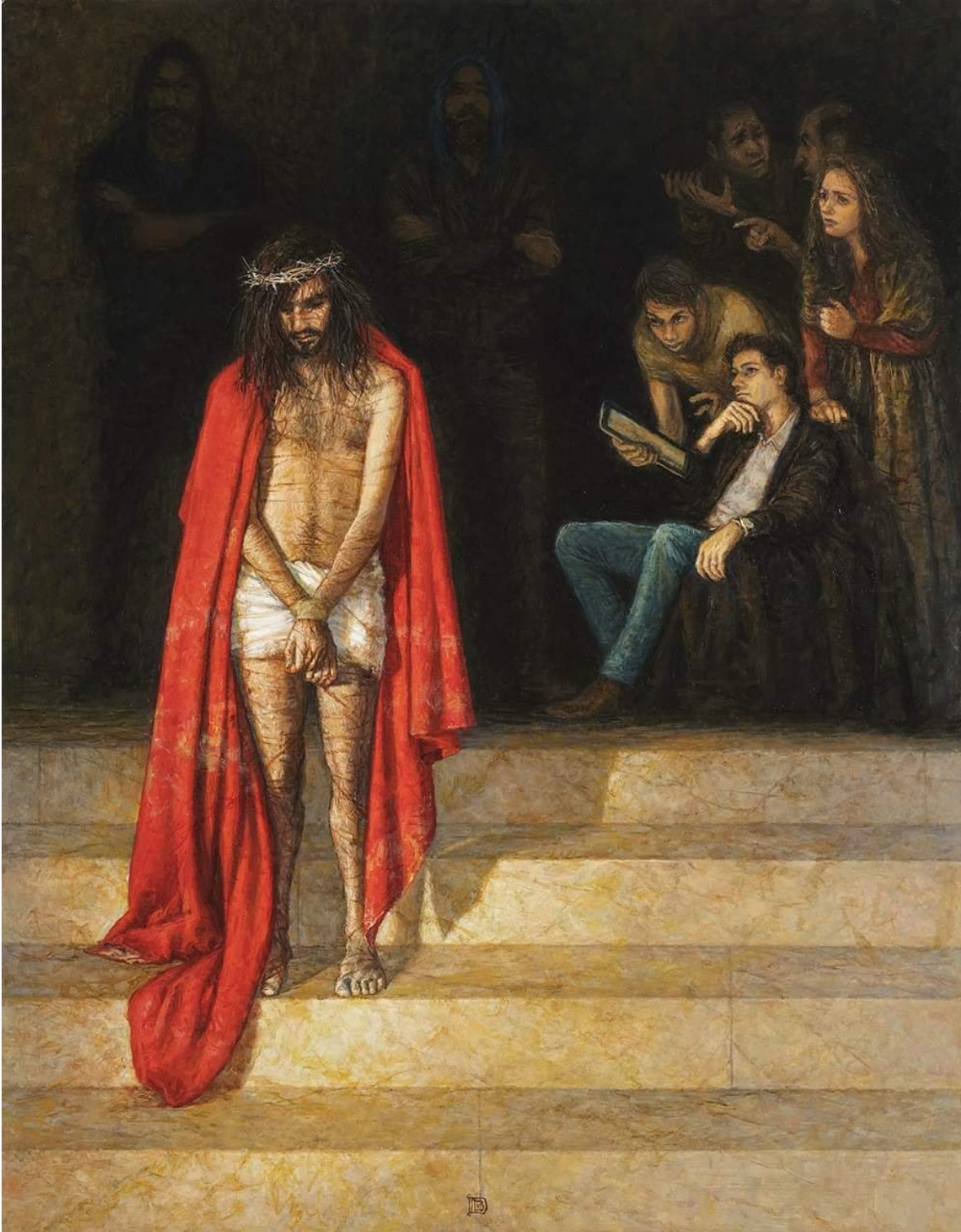
I Estación: Jesús es Condenado a Muerte