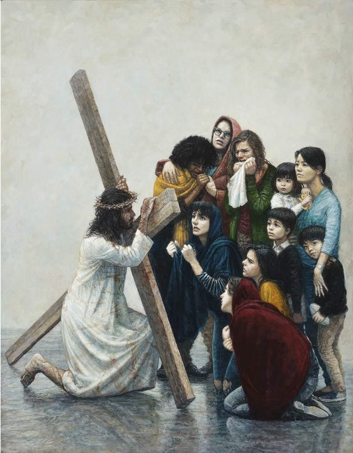
VIII Estación: Jesús Consuela a las Mujeres de Jerusalén