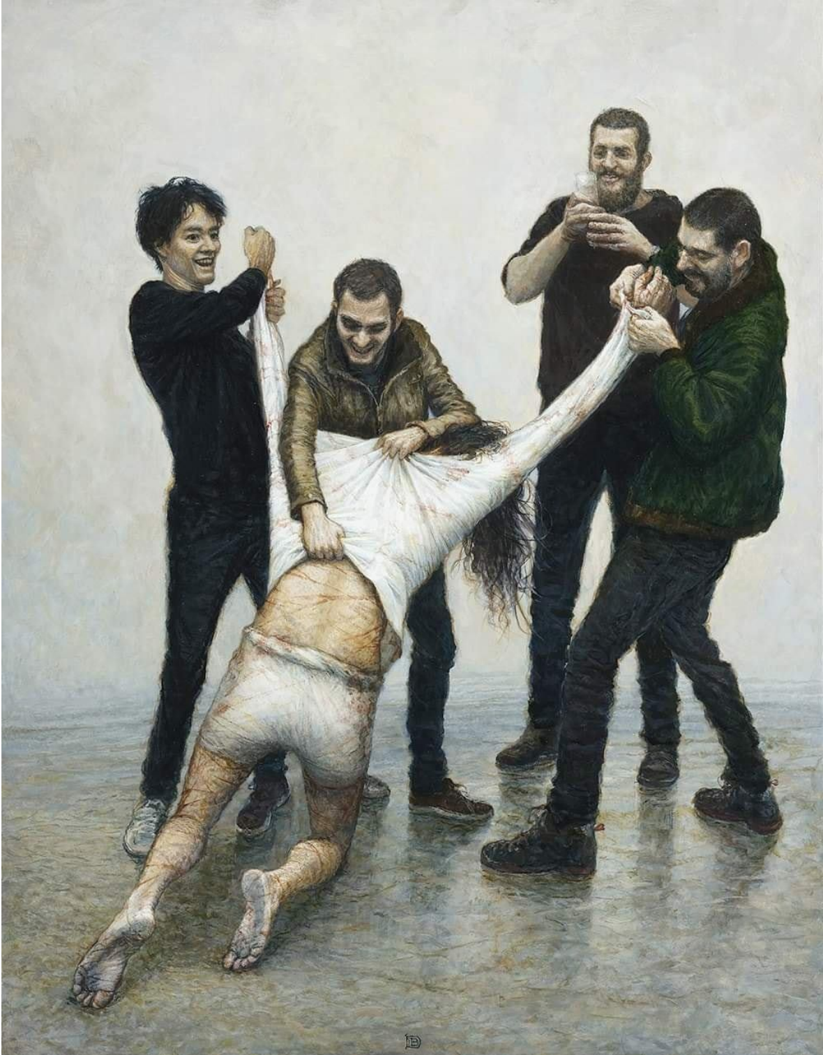
X Estación: Jesús es Despojado de sus Vestiduras