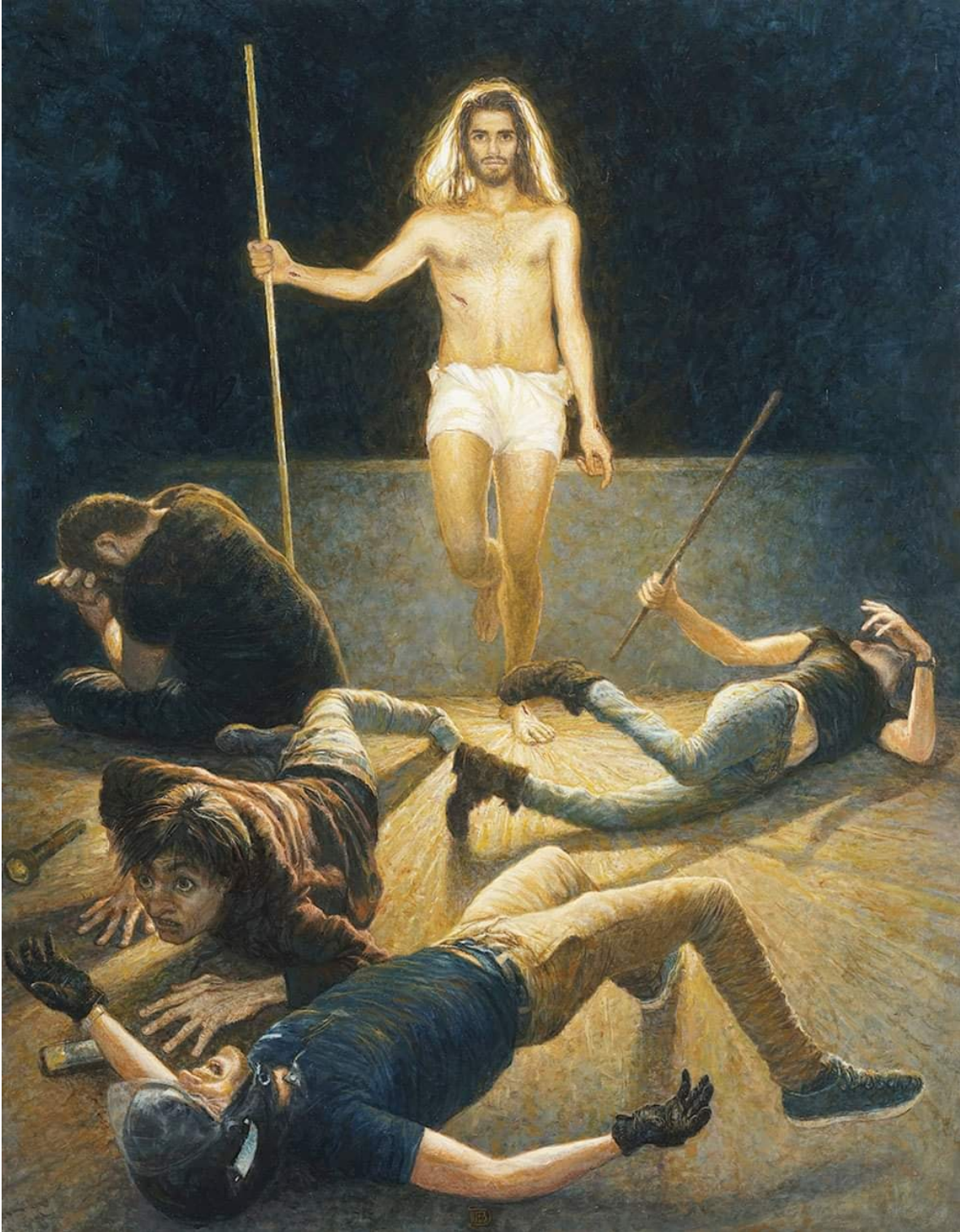
XV Estación: Jesús ha Resucitado