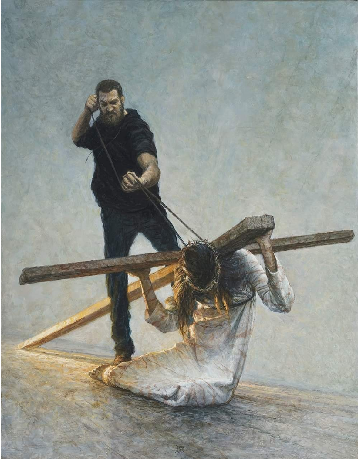
VII Estación: Jesús cae por Segunda Vez