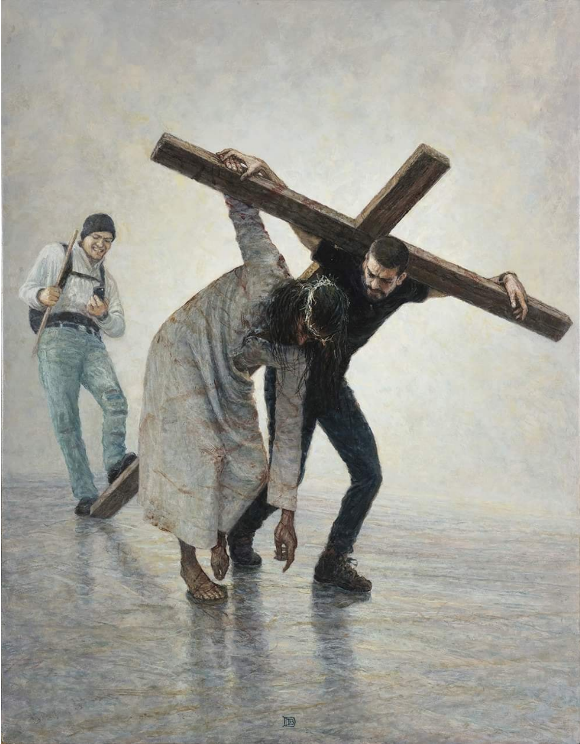
V Estación: El Cireneo Ayuda a Jesús a llevar la cruz