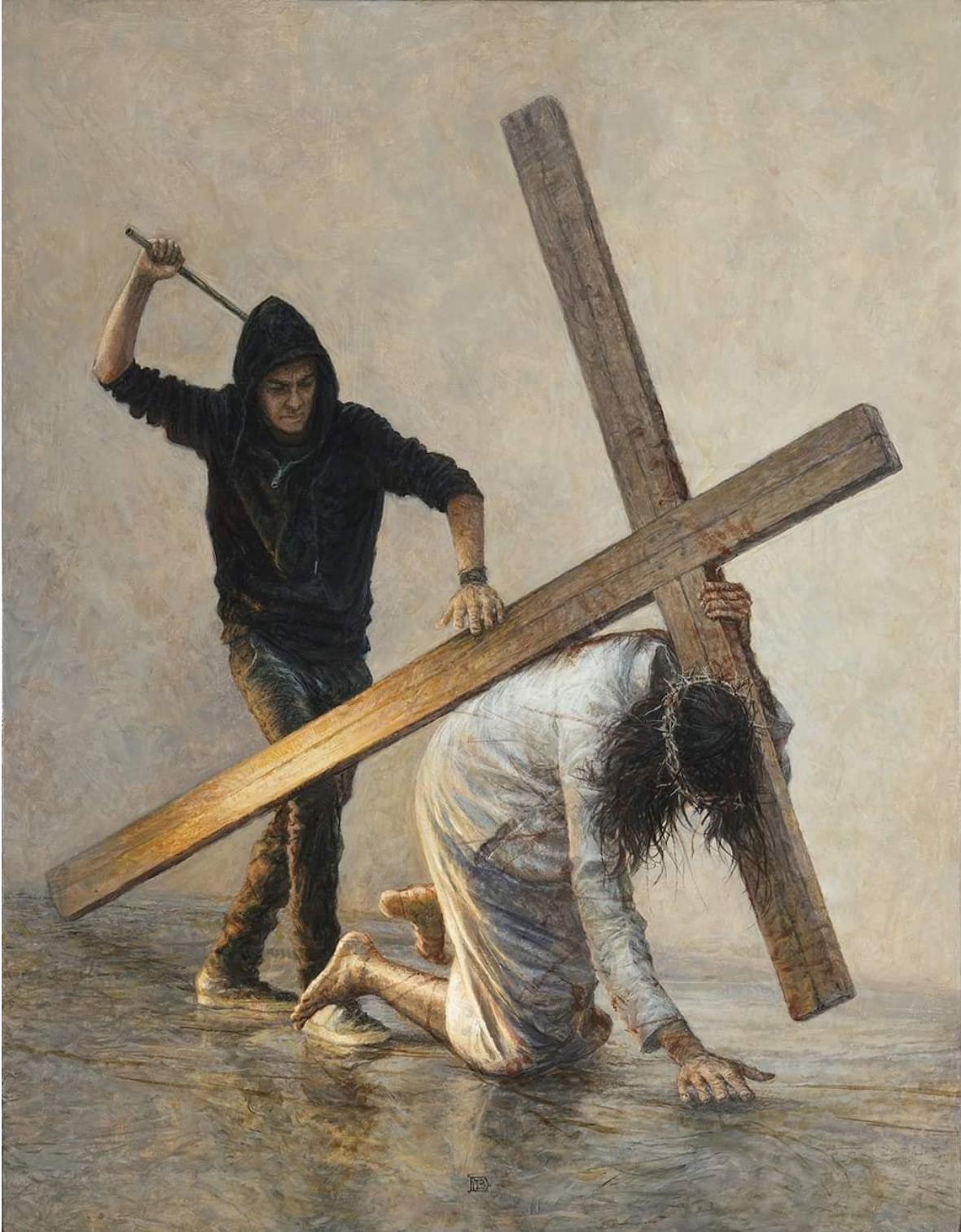
III Estación: Jesús cae por Primera Vez