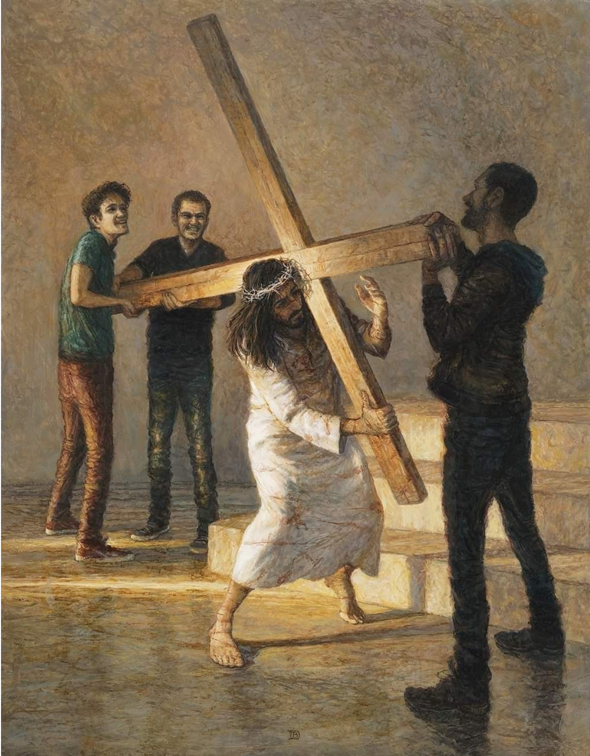
II Estación: Jesús Carga con la Cruz