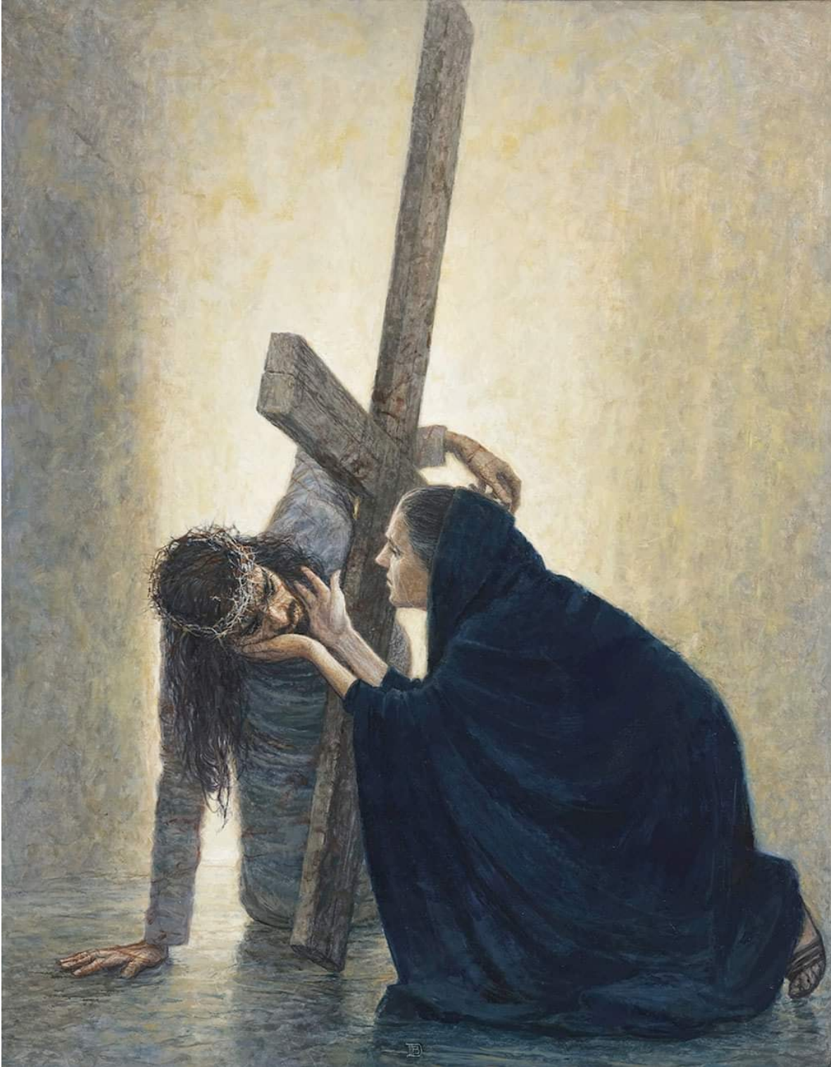
IV Estación: Jesús se Encuentra con su Madre