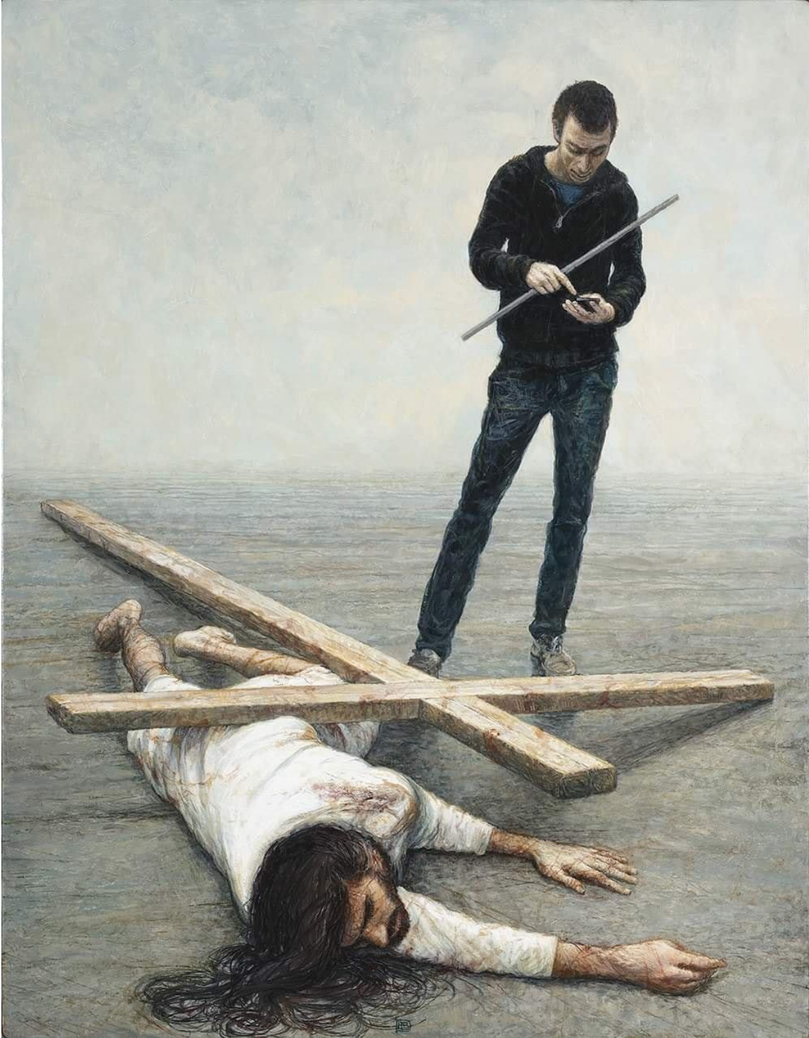
IX Estación: Jesús cae por Tercera Vez